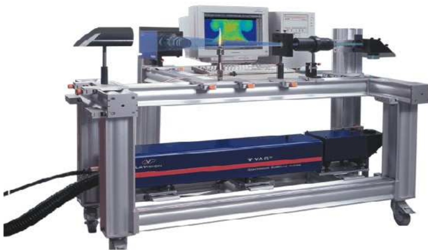
Fig. 1 – Il sistema diagnostico L.I.F. acquisito dalla SSC nel 2000

Tra queste, il L.I.F. (Laser Induced Fluorescence), acquisito dalla SSC nel 2000, permette di rilevare i campi di concentrazione del radicale OH, importante intermedio di combustione, all'interno del fronte di fiamma e di determinare la temperatura della fiamma stessa mediante la diagnostica Rayleigh Scattering.